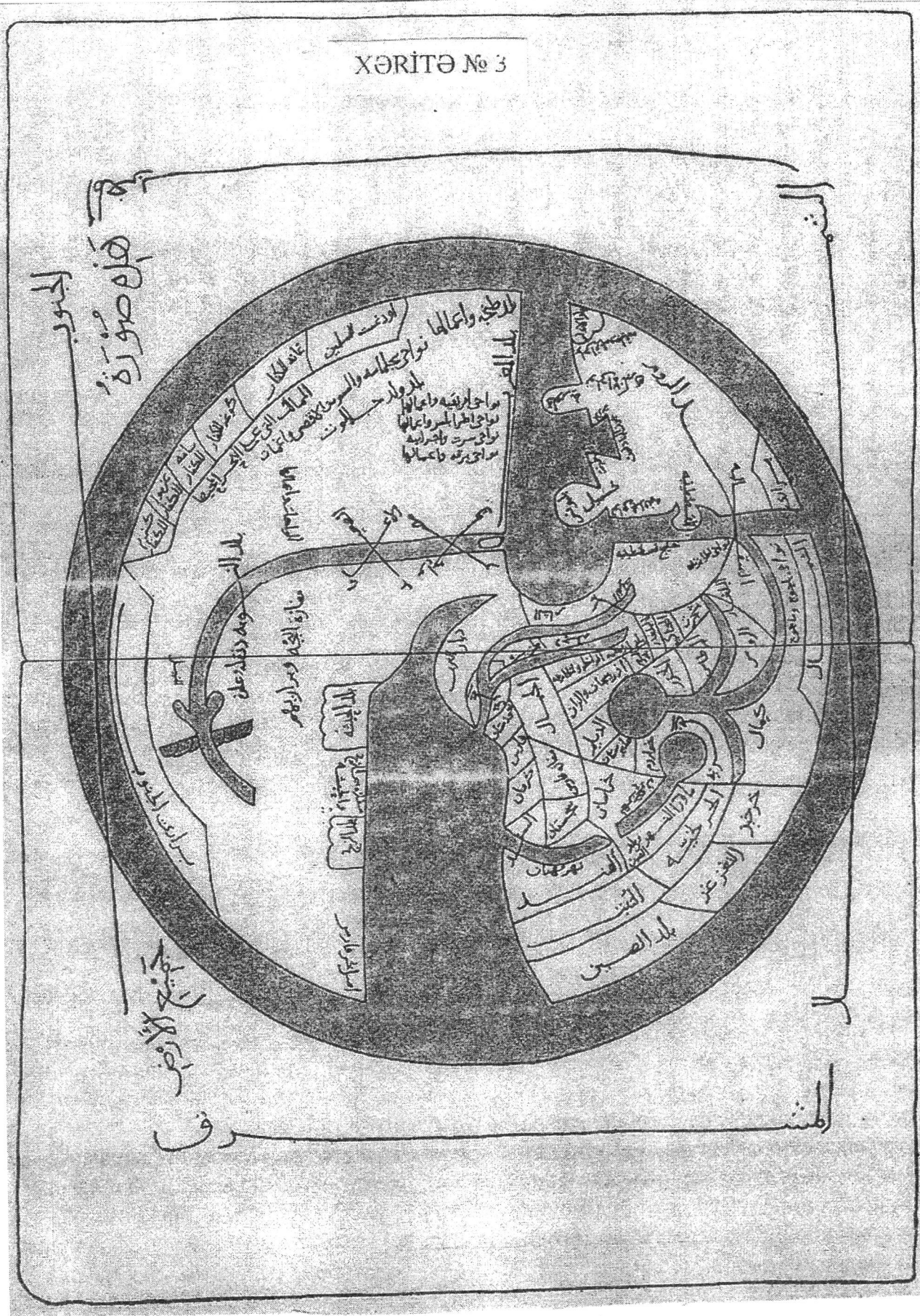
XƏRİTƏ № 3